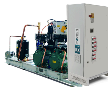
Verbund mit Schaltschrank