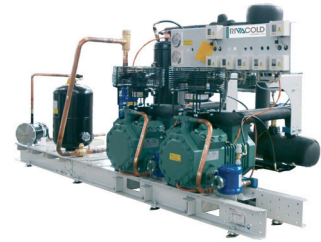
Verbund ohne Schaltschrank