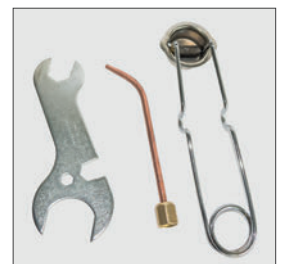
Zusätzlich im Lieferumfang enthalten