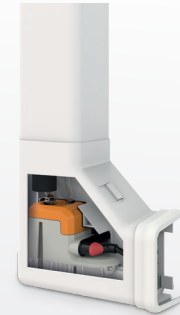
Delta Pack für eine schnelle, einfache Montage und effiziente Wartung