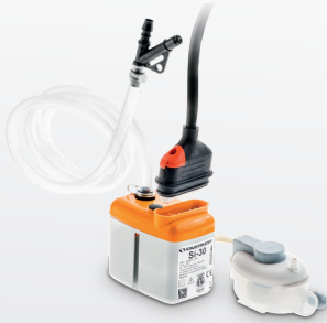
Si-30 leistungsstark und vielseitig!