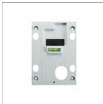
Montageplatte mit Wasserwaage