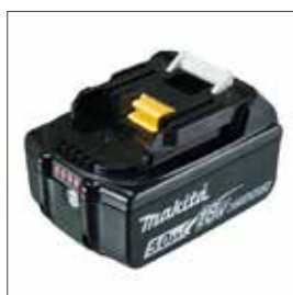
Akku BL1850 18V / 5,0 Ah