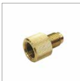
Adapter für Vakuumpumpe