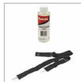
Trageriemen & Hydrauliköl